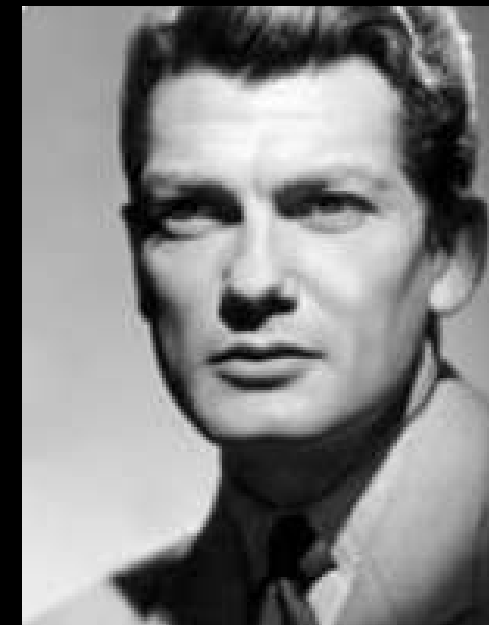
Jean Marais La bête / Le prince / Avenant