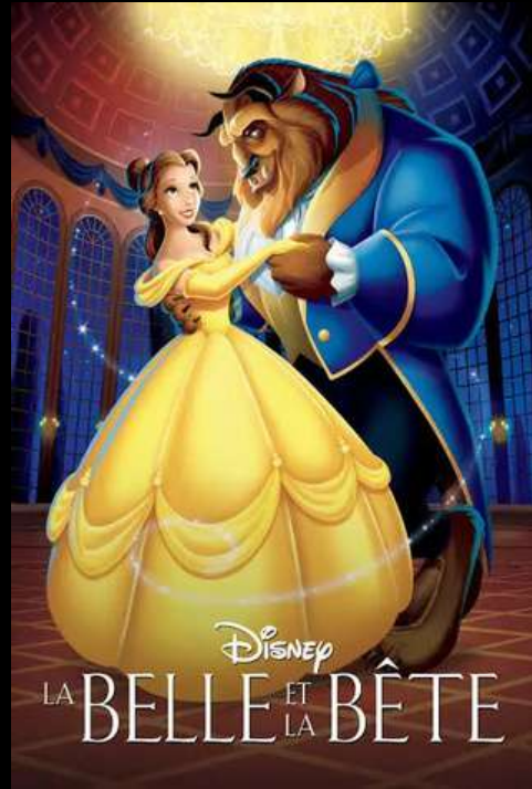
La belle et la bête Gary Trousdale, Kirk Wise 1991