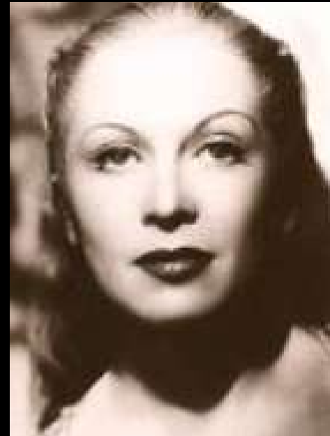
Josette Day Belle