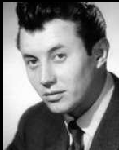
Michel Auclair Ludovic

Ces acteurs ont contribué à rendre "La Belle et la Bête" un chef-d'œuvre du cinéma français, avec une performance exceptionnelle qui a marqué l'histoire du film.