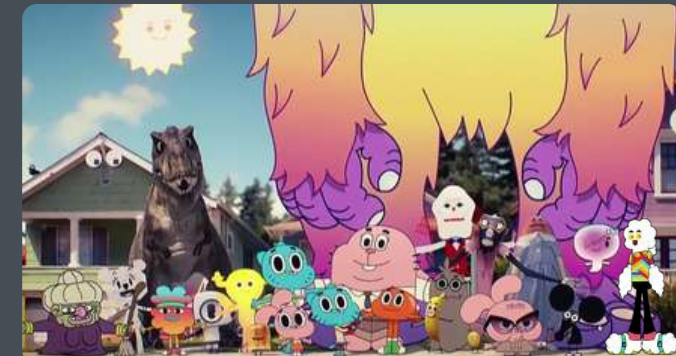
Petit panel des personnages les plus importants, amis, profs, famille de Gumball et Darwin. Tout se passe dans la ville d'Elmore