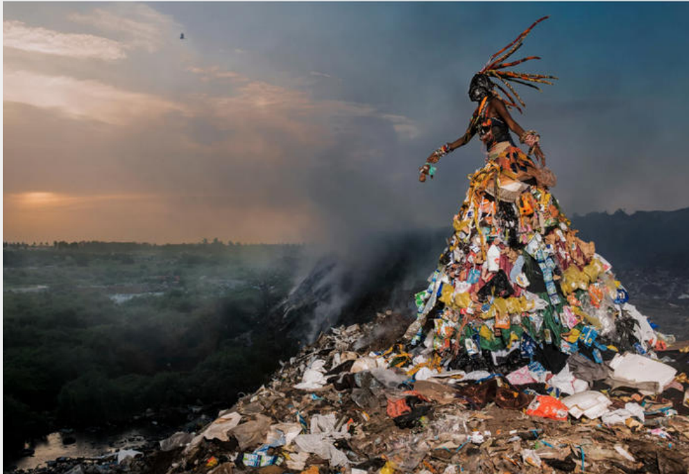
FABRICE MONTEIRO, "UNTITLED #1" (DE LA SÉRIE "THE PROPHECY").