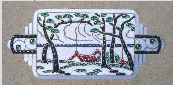
Anonyme - Broche Village

Disons que "dessin de bijoux" est un terme générique qui regroupe différentes techniques (aux crayons ou aux feutres par exemple). Mais aujourd'hui, on entend surtout "gouaché" par ce terme. Un gouaché c'est tout simplement la peinture d'un bijou, à échelle réelle (échelle 1), avec de la gouache (d'où son nom).