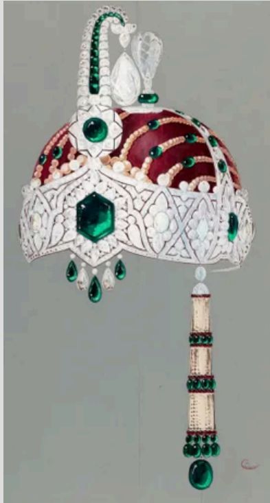
Charles Jacqueau pour Cartier - Coiffe de maharadjah

Pour ce qui est de l'utilité, j'associerai ça à un moyen. L'usage d'une chose utile nous permet d'atteindre une fin. En ce sens, le gouaché est utile car c'est en quelque sorte la fiche technique du bijou. Le gouacheur aura peint le bijou sous plusieurs angles afin de faire comprendre le volume, montrer tous les détails et aspects techniques. C'est au gouaché que va se référer le joaillier pour concevoir la pièce. Sans gouaché, pas de bijou ! De plus, les gouachés sont présentés aux clients afin qu'ils aient une idée de ce à quoi va ressembler leur commande et si besoin demander des ajustements. Finalement, les gouachés permettent aux maisons joaillières de présenter une sortie de collection, même si les pièces ne sont pas encore réalisées.